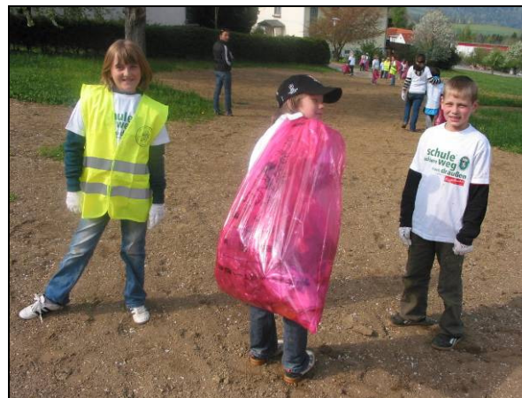
Unsere fleißigen Helfer

Der große steirische Frühjahrsputz - von unserer Landesregierung (FA 19D) ins Leben gerufen - bei uns durchgeführt von der Ortseinsatzstelle der Berg- und Naturwacht sowie der Gemeinde, fand heuer am 18.4. mit der Berg- und Naturwacht St. Lorenzen a. W. und naturbewussten Bürgern statt.