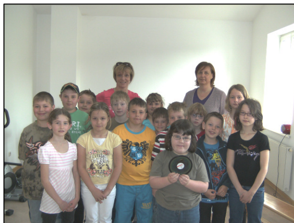
Die Schüler bei der Übergabe des Geschenks

die Aufgaben der Lebenshilfe und die Klienten zeigten in teils beeindruckender Weise ihr Können auf verschiedenen handwerklichen Gebieten.